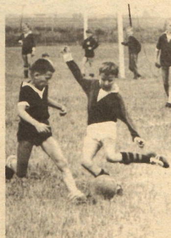
Auch die Jüngsten kämpfen bei den Kreisspartakiaden mit großem Eifer und Einsatz um den Sieg.

Zwei Vertretungen trugen sich in die Siegerlisten der Spartakiade ein. Die BSG Aktivist Espenhain (Knaben, Schüler und Junioren) und die