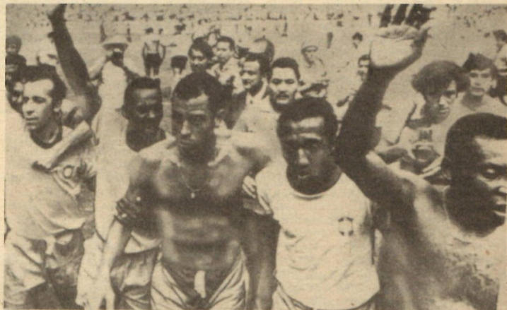
Brasilien im Endspiel! Begeistert verlassen die Südamerikaner das Jalisco-Stadion in Guadalajara, wo sie in fünf Begegnungen erstklassigen Fußball geboten hatten. Von links erkennen wir Tostao, Brito, Jairzinho, Paulo Cesar und Pele.